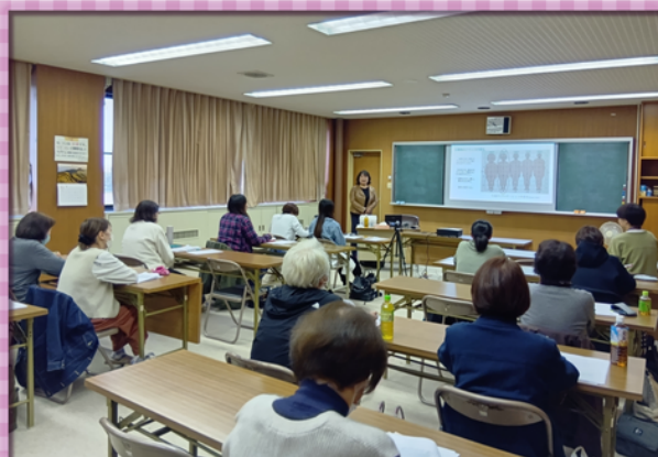
・提供会員養成講座・