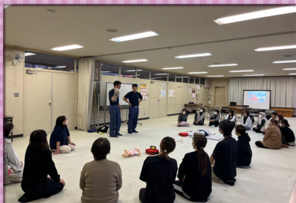
・普通救命講習Ⅲ・