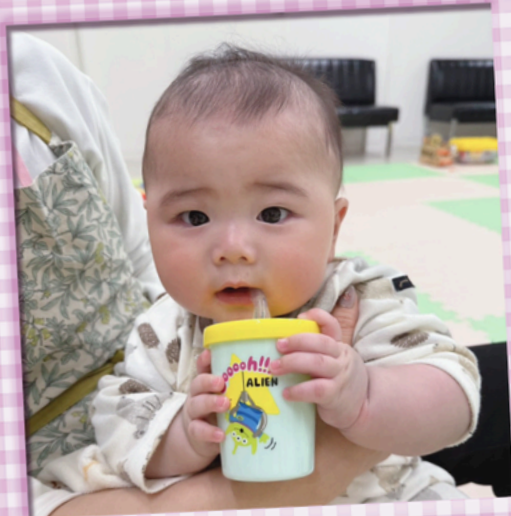
・すてっぷ広場での託児・