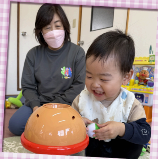
・子育てステーションでの託児・